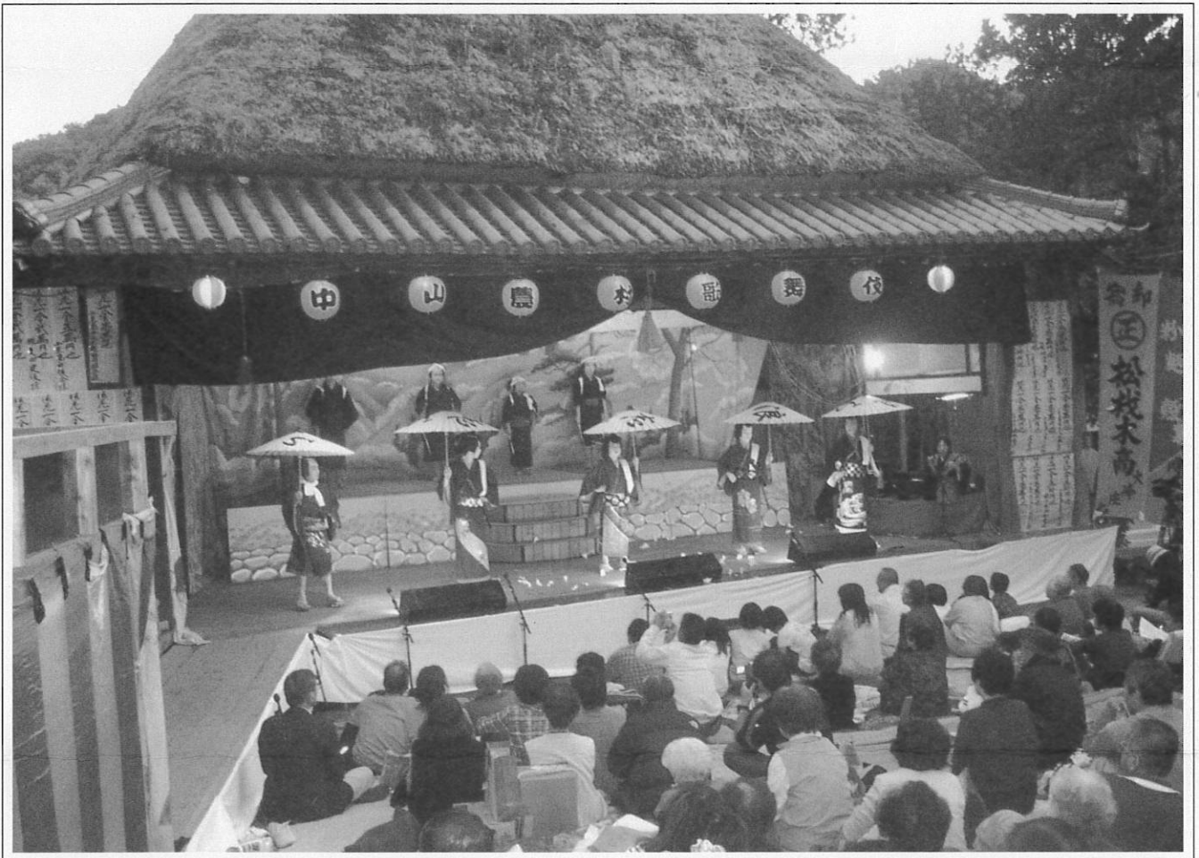
重要有形民俗文化財「中山の舞台」 昭和62年3月指定